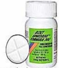
25mg Ephedrine HCL 200mg Guaifenesin

You can purchase low price Ephedrine online or find Ephedrine related products from any of the online vendors listed in the Ephedrine Price Comparison Chart .