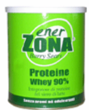
Zona Barry Sears Proteine Whey 90