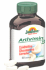
Arthrimin C Glucosamina Condroitina Complex