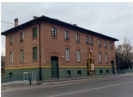
La sede del Servizio 118 Modena Soccorso

fisse o stagionali, solo 3 operano con equipaggi misti (infermiere 118 e volontari), mentre le restanti operano con equipaggi costituiti soltanto da volontari soccorritori.