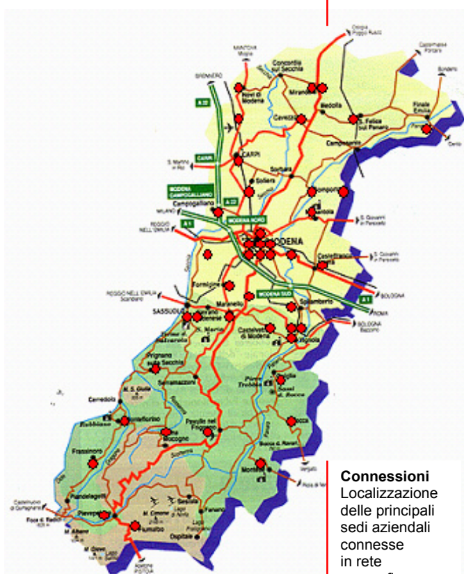
Connessioni Localizzazione delle principali sedi aziendali connesse in rete geografica

Alcuni indicatori del livello di copertura raggiunto