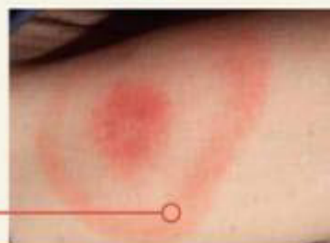
Eritema migrante, malattia di Lyme