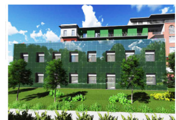
Montecatone Rehabilitation Hospital