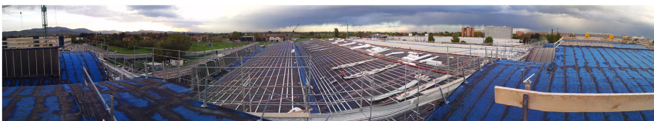
Ducati Motor Holding S.p.A. – Intervento di Miglioramento Sismico di fabbricato produttivo