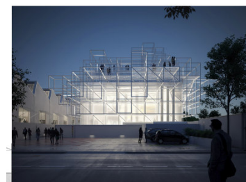
Fondazione Golinelli, Bologna Centro Arti e Scienze