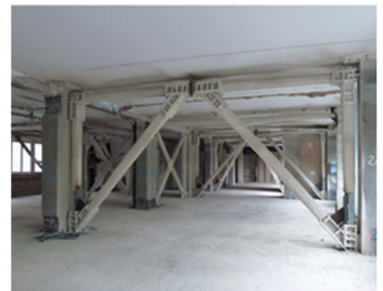
Policlinico Modena – Ripristino parti strutturali danneggiate da sisma