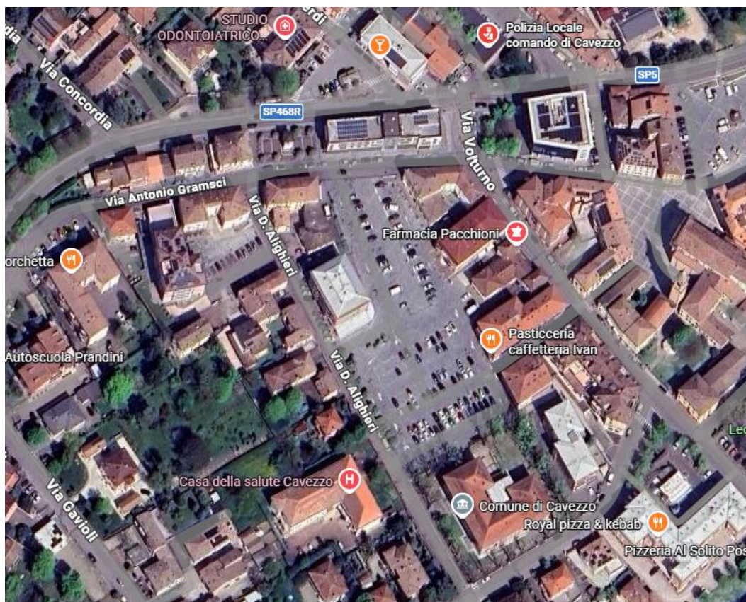
Figura 1. Mappa territoriale Casa della Comunità di Cavezzo

La struttura è localizzata in una zona facilmente accessibile e ben collegata, con parcheggio libero e gratuito adiacente, ed è dotata di spazi funzionali e accoglienti pensati per garantire l'integrazione dei servizi e il comfort dell'utenza. In particolare, la struttura è circondata da aree di verde pubblico ed è adiacente alla sede del Comune di Cavezzo. Nelle vicinanze è presente la sede della Polizia Municipale.