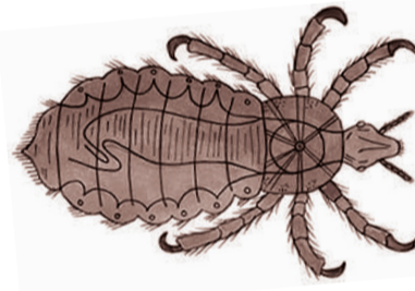
Pidocchio dei capelli Head lice Saçlardaki bitler 头虱 ਵਾਲਾ ਦੀਆ ਜੁੱਆ قمل الشعر بالوں کی جوئیں

2 جوئیں دو سے تین ملی لیٹر لمبی اور ناکستی رنگ کی ہوتی ہیں، ان کے انڈوں کو چھونے سے یہ ریت کے ذرے کی طرح محسوس ہوتے ہیں اور سختی سے بال کے ساتھ جمتے ہوتے ہیں۔