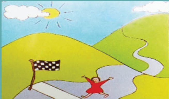
Un Cammino di Libertà

Gli inserimenti in famiglia migliorano le condizioni dell'ospite, della famiglia e della comunità tutta. Contribuiscono a contrastare i pregiudizi e i falsi miti sulla malattia mentale.