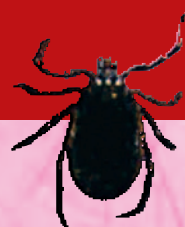
maschio 2,5 - 3,5 mm