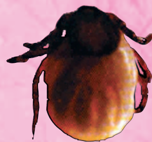
femmina dopo il pasto 10 mm

lunghi periodi di tempo al digiuno assoluto e sono in grado di avvertire l'approssimarsi di un ospite diventando molto attive.