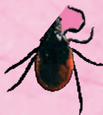
femmina prima del pasto 3,5 - 4,5 mm